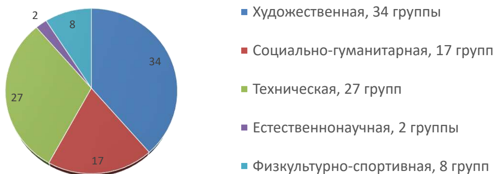
Направленности УДЮЦ 2025 год:

Реализовалось 69 программ дополнительного образования, которые обновлены по новым требованиям, предъявляемым к ДООП, 20 программ прошли региональную экспертизу НОКО, представлены разные виды программ: 7 сетевых программ, 1 дистанционная, 5 разноуровневых, 2 адаптированных.